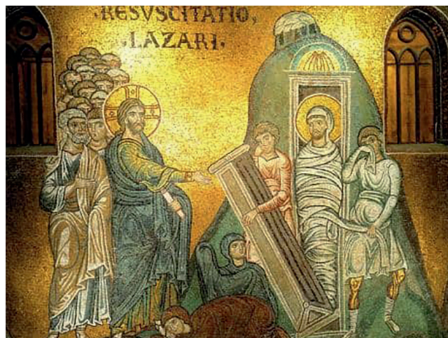
Lazarus-Mosaik in der Monreale Cathedral, Sizilien

Alles begann im Lazarus-Hospital vor den Mauern Jerusalems, gegründet um ca. 370 n.Chr. Als Stifterin gilt die oströmische Kaiserin Aelia Eudoxia. Daraus geht im 11. Jahrhundert der Orden des Heiligen Lazarus hervor.