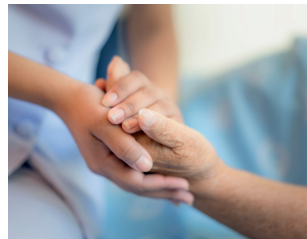
Soziale Tätigkeit in Österreich z.B. in der Altenbetreuung

Der Lazarus Orden, offiziell: Militärischer und Hospitalischer Orden des Heiligen Lazarus von Jerusalem, ist eine christliche, ritterliche Ordensgemeinschaft, die vor über 900 Jahren als geistlicher Ritterorden in Jerusalem gegründet wurde.